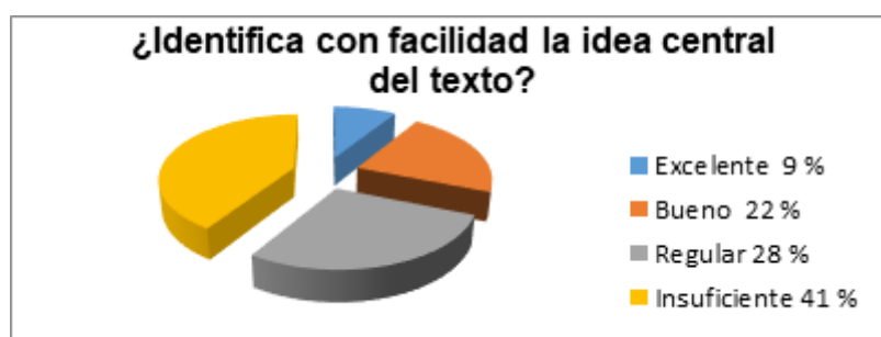
Figura 3. Pregunta 3. ¿Identifica con facilidad la idea central del texto?

Una vez más se puede confirmar la necesidad de la aplicación de la metodología de enseñanza aprendizaje para el desarrollo en los estudiantes, habilidades de lectura comprensiva, aspecto elemental para lograr verdaderamente los propósitos de aprendizajes en los estudiantes del grado correspondiente y por ende del nivel primario en general.