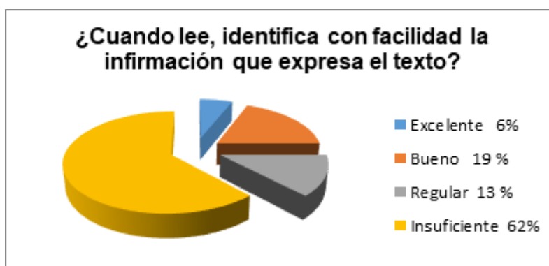
Figura 2. Pregunta 1. ¿Cuándo lee, Identifica con facilidad la información que expresa el texto?

Para la aplicación de la guía de observación se coordinó sesiones de clase planificada con la maestra de grado con contenidos relacionados con el área de Comunicación y Lenguajes y que además se podían integrar las demás áreas de conocimiento, resultado de ese proceso, se detalla a continuación los resultados encontrados: