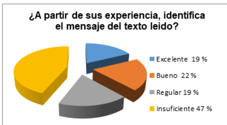
Figura 4. Pregunta 4. ¿A partir de su experiencia, identifica el mensaje del texto leído?

total de motivación por ser parte del proceso y/o la tarea de lectura realizada.