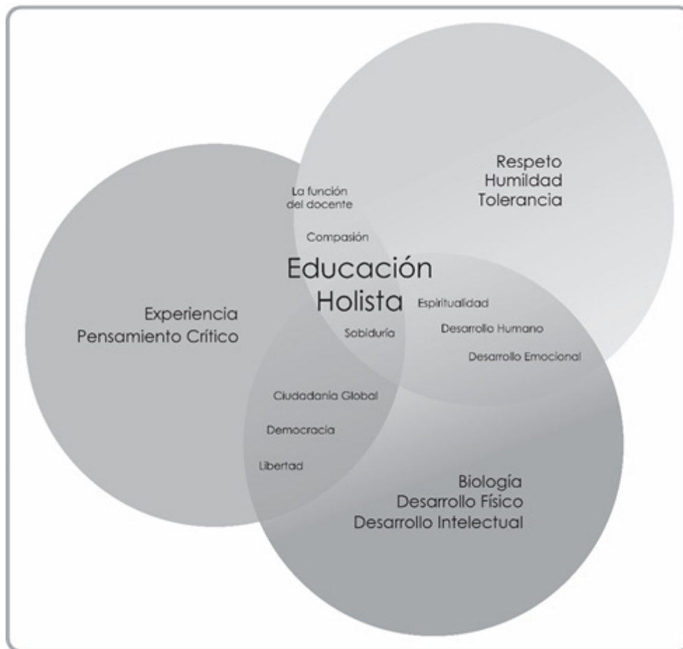
Figura 1. Diagrama sobre los conceptos de la Educación Holista.

pensar en el alumno como un todo, y como una potencialidad la cual se busca activamente. En este caso, la pedagogía Montessori se acerca a esta forma de enseñanza gracias a que atraviesa al ser humano a partir de la libertad. Los planos constitutivos (son cinco) del ser humano parten de esta idea: lo físico, biológico, espiritual, emocional e intelectual.